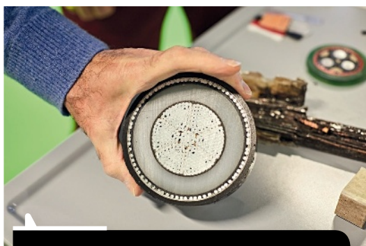
Tous les matériaux subissent l'influence de leur environnement, vieillissent et se dégradent. C'est pourquoi il faut les surveiller en permanence.

TP ► «Ce procédé est un gage de sûreté, puisqu'il permet à l'exploitant de la centrale d'avoir 10 ou 20 années d'avance sur le vieillissement réel du métal constitutif de la cuve et de prévoir ainsi l'évolution des équipements.» Suite en page 14